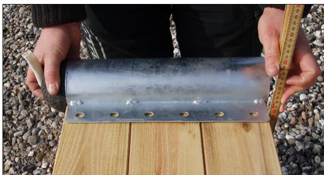
Underkant bræt og bundende af rør beslag lines op hvorefter der opmærkes på yderside - til senere boring af huller.