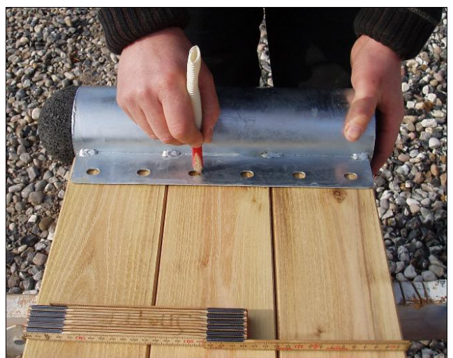
Pænt hvis der holdes ca. 1cm luft fra ende bræt til rørbeslag.